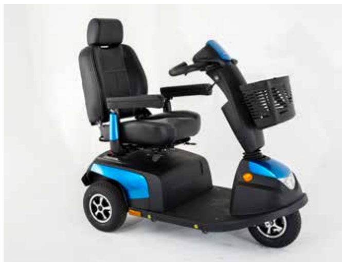
3-wiel Orion PRO