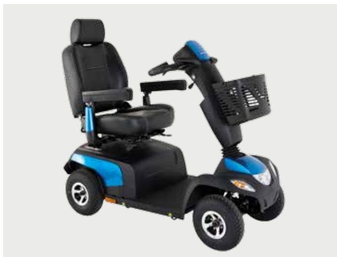
4-wiel Orion PRO